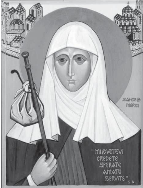
Afb. 73 Icoon van Angela Merici door Anna Porro, Ursuline van de Romeinse Unie, twintigste eeuw.